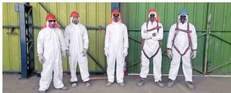
Equipo de trabajo de DEXACHILE

Enfatiza el empresario que la autoridad sanitaria, el seremi de Salud, es la encargada de la fiscalización de los procedimientos de acuerdo con la normativa vigente, ya que el asbesto es altamente