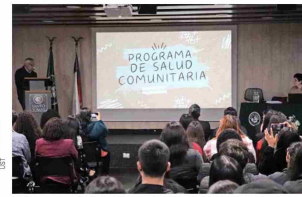
El Programa de Salud Comunitaria se imparte en todas las facultades de Salud de la UST, de Arica a Puerto Montt.