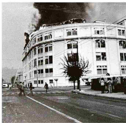
INCENDIO EN LA COMPAÑÍA CHILENA DE TABACOS DE AVENIDA COLÓN.

Las numerosas fallas ocurridas en la infraestructura, especialmente vial y sanitaria, permitieron obtener valiosa informa-