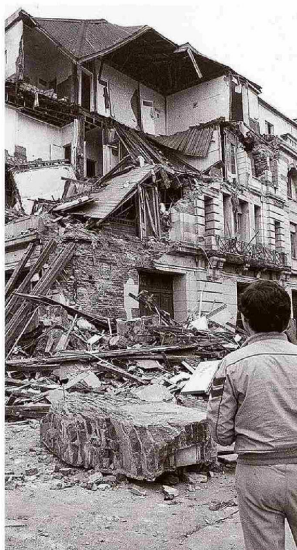
ANTIGUO INMUEBLE EN EDWARDS CON BLANCO, EN VALPARAÍSO.

Un puesto de mando en la Dirección General del Cuerpo coordinó los pasos a seguir para abastecer de agua a la gente: sencillamente, desplegar a