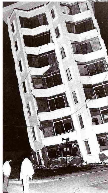
EDIFICIO "EL FARO", UBICADO EN CALLE LA JOYA, EN REÑACA.

"En 1985 hubo un tsunami, aunque pequeño y por eso los que vivimos ese terremoto casi no nos enteramos. El mecanismo del sismo, es decir la liberación abrupta de las placas trabadas, fue el mismo que produjo los últimos grandes terremotos del 2010 del Maule y del 2015 en Illapel, dejando a Valparaíso en medio", explica el investigador principal del