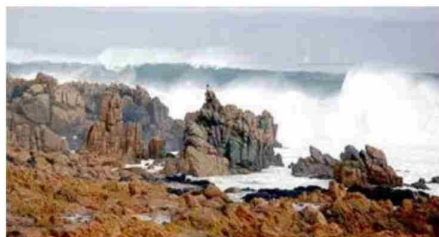
El Senapred declaró alerta temprana preventiva para las comunas en el borde costero, desde Arica hasta Golfo de Arauco y Archipiélago Juan Fernández.

Se establece la prohibición de acercarse a sectores rocosos, y que representen riesgo, especialmente para los turistas que de manera masiva visitan el litoral maulino.