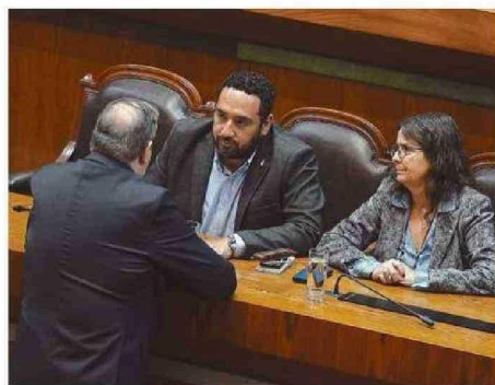
EL MINISTRO DE EDUCACIÓN, NICOLÁS CATALDO, ESTUVO EN SALA.

Entre otros aspectos, en el ámbito del bienestar de los equipos educativos, se propone reforzar el resguardo de la autoridad pedagógica y los derechos de las y los trabajadores de la educación, para lo cual se mejorarán los estatutos