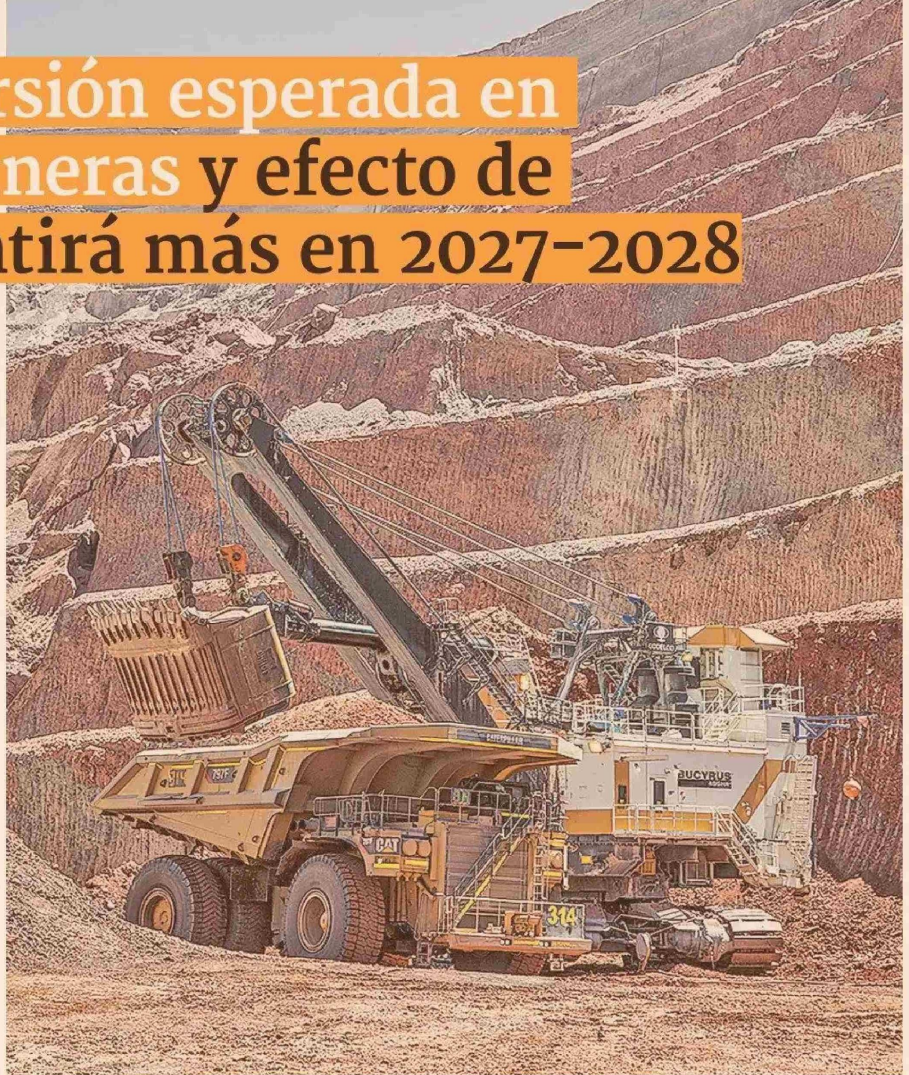
ESTIMACIONES DE INVERSIÓN EN EL SECTOR MINERÍA EN MILLONES DE US$

De acuerdo con la CBC, para el próximo año destacan los proyectos Adecuación Operacional Spence, Nueva Centinela y Desarrollo de Infraestructura y Mejoramiento de Capacidad Productiva de Collahuasi, que representan el 50,2% del total estimado a ejecutar en 2025.