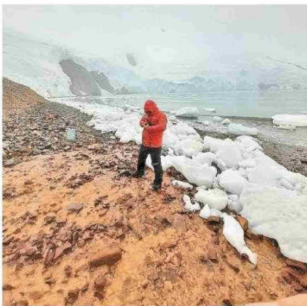
Trabajo en terreno durante el verano antártico del año 2022 (Eca 58), en el sitio con generación de drenaje ácido de rocas en la caleta Cardozo, isla Rey Jorge.

vechadas para descontaminar compuestos tóxicos como el perclorato y el nitrato, presentes en efluentes de diversas industrias.