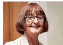
Rosa Devés Rectora de la Universidad de Chile

Primera mujer campeona olímpica de Chile. Es especialista en el tiro al plato ( skeet ), deporte que empezó a practicar de manera regular a los 13 años. Desde 2012, ha participado en cuatro Juegos Olímpicos, el último fue el de París 2024, donde ganó medalla de oro. Previo a ello, había sido reconocida en 2019 con el Premio Nacional del Deporte. Y fue la primera deportista chilena en clasificarse a los Juegos Olímpicos de Tokio 2020.