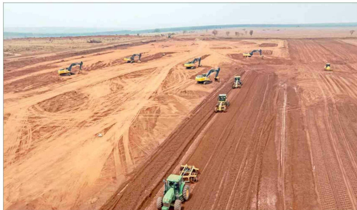
La firma chilena comenzó los movimientos de tierra en Brasil para la construcción del Proyecto Sucuriú, que tendrá una planta con capacidad de producción anual de 3,5 millones de toneladas de celulosa.