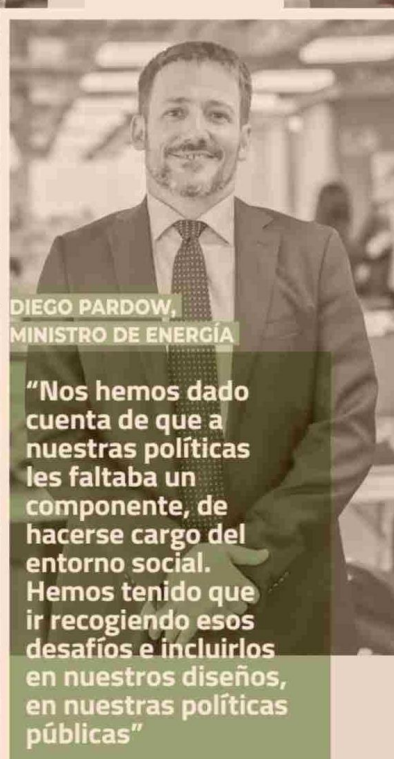
DIEGO PARDOW, MINISTRO DE ENERGÍA

"El desafío hoy, junto con esta mejora de productividad, tiene que ver con cómo minimizamos, reducimos, nuestros impactos y generamos legitimidad socioambiental. En minería eso es lo clave"