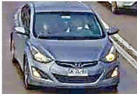
EL VEHÍCULO DE LA BANDA HABÍA INGRESADO A LA COMUNA EN DÍAS ANTERIORES AL DELITO.

A los pocos segundos arribaron personal de Seguridad Ciudadana y funcionarios de carabineros de Santo Domingo. Al ver la reacción de los vecinos, a los antisociales no les quedó otra alternativa que optar por una rápida retirada. Cuatro de los sujetos abordaron un automóvil Hyundai en el que habían llegado a la parcelación y que dejaron estacionado a un costado de la propiedad, mientras un quinto individuo salió corriendo por la parte posterior de la