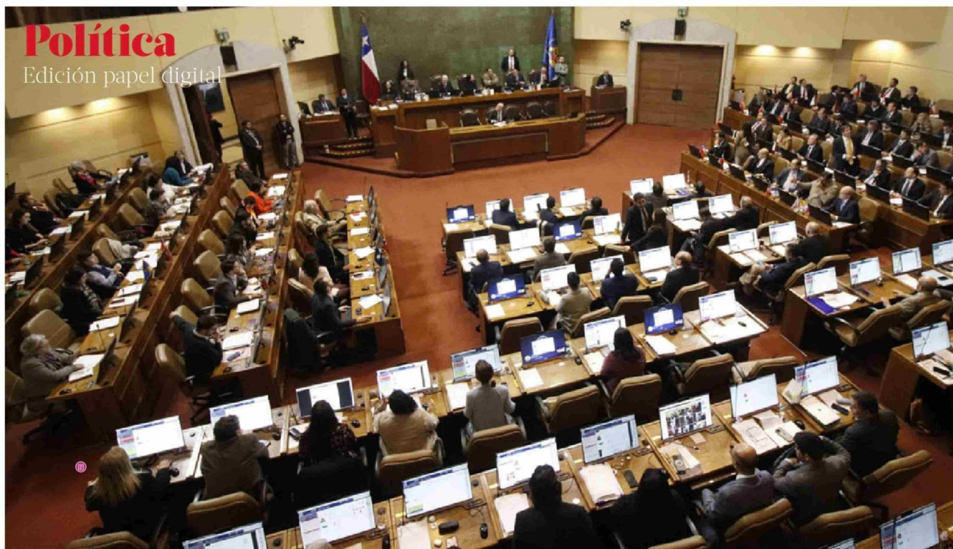
► El proyecto estuvo en tramitación durante siete años.