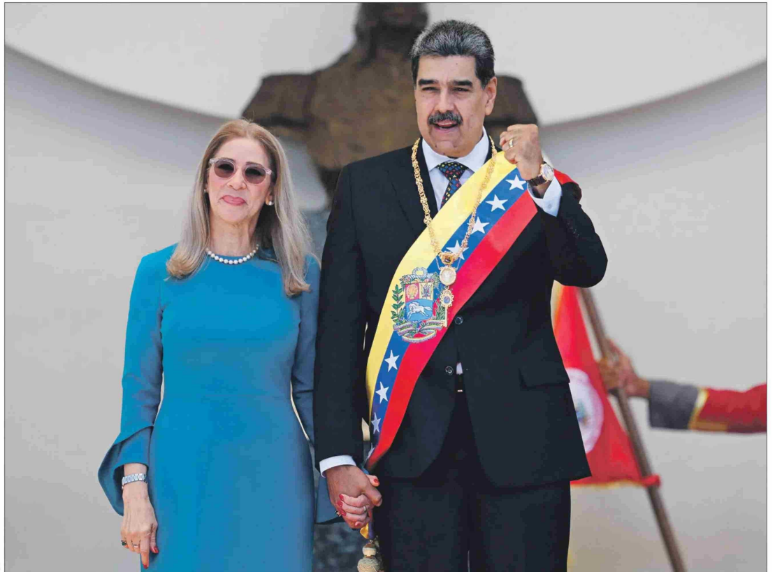
Nicolás Maduro inició este viernes su tercer periodo como presidente de Venezuela.

"Chávez cayó fascinado ante las artimañas del gran embaucador que fue Fidel Castro, quien le hizo creer que sería su heredero como líder de la revolución continental", agrega.