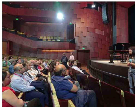
EL IMPRESIONANTE TEATRO DEL LAGO DE PUERTO VARAS FUE VISITADO POR LOS ASISTENTES AL ENCUENTRO.