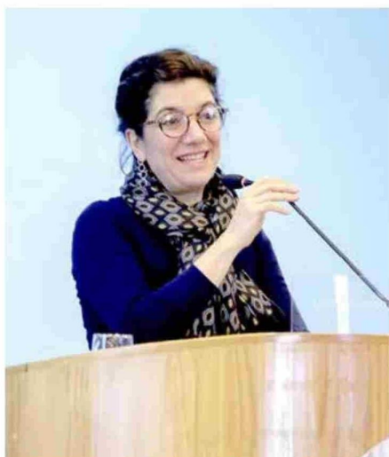
Ministra de Ciencia, Aisén Etcheverry.

Titular de Ciencia. La autoridad de Gobierno participó en el seminario Ciencia en el Aire y que además, contó con exposiciones de importantes divulgadores científicos.