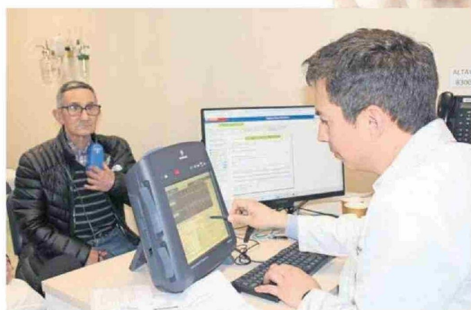
EL HOSPITAL DE VILLARRICA LLEVÓ A CABO 130 ATENCIONES EN UN OPERATIVO CARDIOLÓGICO.