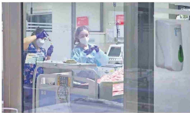
LA TAREA PRINCIPAL ES PREVENIR, EVITAR QUE LOS PACIENTES LLEGEN A ETAPAS IRREVERSIBLES.

Detectar de manera precoz alguna anomalía evita complicaciones que puede derivar en una muerte cardíaca. Así lo expresa el doctor Lanás. "Por esta razón - resalta - existe el Mes del Corazón, porque como sociedad debemos apostar a la prevención, a cuidarnos antes de que lo lamentemos. Y lo recomendable aquí es adoptar un estilo de vida saludable, optar por lo más sano; mantenernos delgados, hacer ejercicio, alimentarnos bien y no fumar. Con eso ya tenemos un tremendo pasogano para nuestra salud. Y si ya no se es una persona joven debemos acudir a un médico de cabecera y ha-