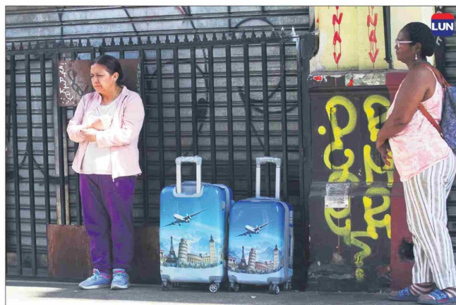
Los damnificados recibirán ayuda del municipio de Santiago.

mente” el recinto era ocupado informalmente por desconocidos, y que además del ex hotel, el fuego arrasó con dos locales comerciales de un edificio contiguo y dos viviendas de un cité. Los damnificados recibirán asistencia del municipio de Santiago.