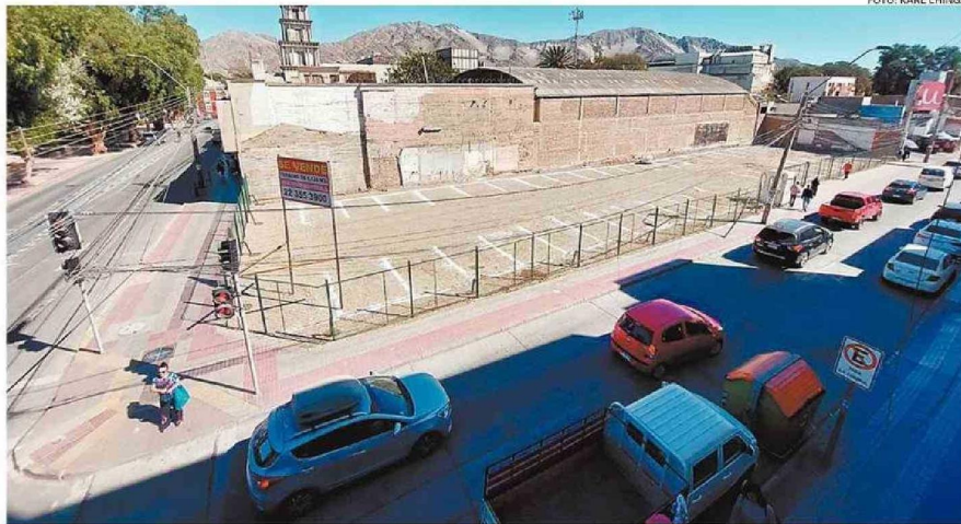
EL ÚLTIMO ESTACIONAMIENTO QUE FUE ABIERTO FUE EN LOS CARRERA CON CHACABUCO, DONDE ESTABA LA IDEA DE LEVANTAR UN CENTRO COMERCIAL.

"Es evidente que los estacionamientos de pago en el centro de Copiapó, que han proliferado de manera evidente en el último tiempo, sin orgánica, responden a una necesidad, que es el aumento explosivo del parque vehicular en Copiapó, lo que también se puede apreciar en cómo han ido aumen-