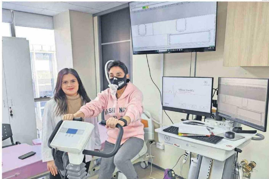
LAS PARTICIPANTES REALIZAN UNA SERIE DE RUTINAS, ENTRE ELAS DE TIPO INTERVÁLICO DE INTENSIDAD VIGOROSA EN UNA BICICLETA ESTÁTICA.

Tanto este tipo de cáncer como otras patologías cardiovasculares se agravan por el sedentarismo, que es la falta de actividad física y un estilo de vida inactivo. Esto es, detalla Álvarez, en no practicar actividad física de baja a mode-