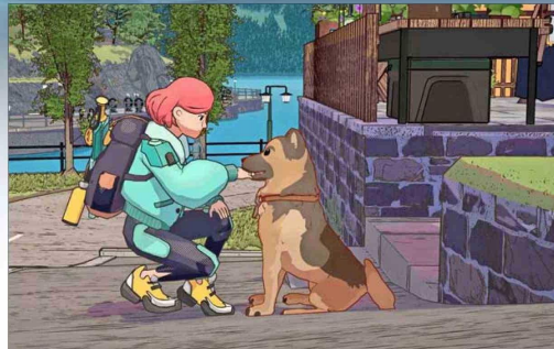
DUNGEONS OF HINTENBERG

Las estadísticas sugieren algo que se vio en la práctica: muchas personas se refugiaron en este tipo de juegos durante la pandemia y la tendencia no bajó tras ella. Un fenómeno similar al de personas que volvieron a armar puzzles, a disfrutar de los juegos de mesa o realizar ma-