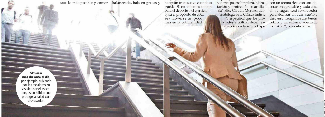
Moverse más durante el día, por ejemplo, subiendo por las escaleras en vez de usar el ascensor, es un hábito que protege la salud cardiovascular.

El especialista añade que el segundo elemento es el ambiente. Las condiciones de luz, el ruido y la temperatura son claves para un buen sueño, así como también el orden del dormitorio. “Si la habitación está desordenada, ‘patas para arriba’, con la cama deshecha, la ropa encima, etcétera, fomenta que nuestra mente también esté desordenada, siente que tiene cosas inconclusas. Si nos preocupamos de tener el dormitorio con un aroma rico, con una decoración agradable y cada cosa en su lugar, será favorecedor para alcanzar un buen sueño y descanso. Tengamos una buena rutina y un entorno adecuado este 2025”, comenta Serra.