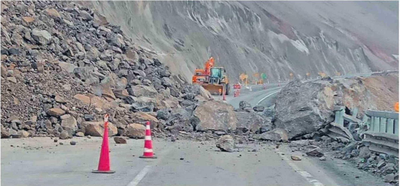
SI BIEN LOS SUCESIVOS DERRUMBES HAN DISMINUIDO ÚLTIMAMENTE, Y SE RESPONDE RÁPIDO PARA DESPEJAR, SE VE LEJOS UN FIN DEFINITIVO