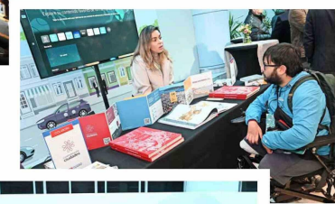
Las diversas fundaciones que participaron del encuentro explicaron los proyectos que están impulsando para la revitalización de los espacios públicos.