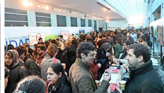
Los colaboradores entre fundaciones y universidades fueron parte de la "Conferencia Internacional de Ciudad 2024".