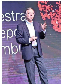
El invitado internacional Guillermo Peñalosa expuso sobre la "Creación de Ciudades 8-80 para todos. Sostenibles, equitativas y divertidas".