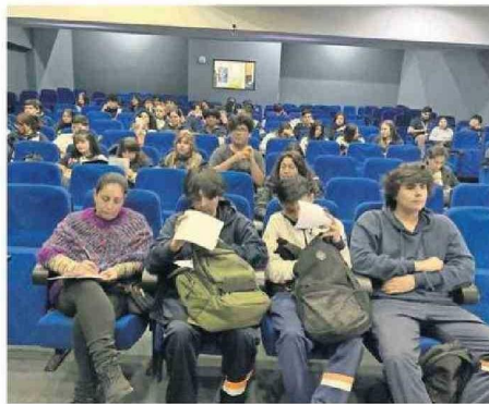
REALIZARON CHARLAS A LOS ESTUDIANTES DE LA REGIÓN.

Con esto, en Antofagasta la Seremi de Educación ha realizado varias actividades de difusión para que los estudiantes que ingresarán a la educación superior en el 2025, puedan acceder sin problemas a los beneficios.