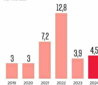
Cuarto año lejos de la meta de 3% Var% anual