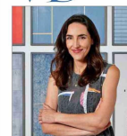
Santiago bajo el lente. Exposición de cuatro fotografías invita a detenerse y mirar la capital más allá de la superficie.

Tal como el dólar, aparece en Argentina el peso chileno "blue"... la moneda nacional es una de las más requeridas | B 4