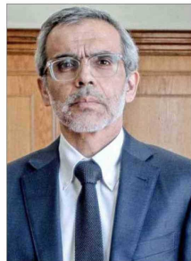
HERALDO MUÑOZ (PS) EXCANCELLER

“Los antecedentes sobre ese punto los verá la Cancillería. No tengo más antecedentes que los requerimientos hechos al Ministerio de Defensa (...). Es importante que evitemos especulaciones”.