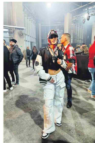
La participante de "Gran hermano" con un top.