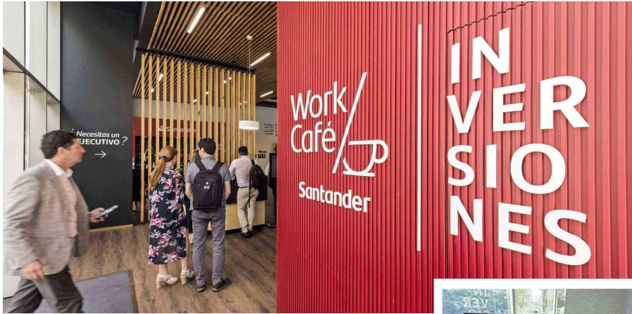
El área de Wealth Management del banco tuvo importantes avances durante el año pasado, especialmente en la unidad de Banca Privada y en Santander Asset Management.