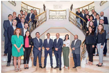
Santander Asset Management fue reconocido en múltiples ocasiones, consolidando su posición como líder en la industria de los fondos mutuos.

banco, señaló que "nuestros equipos buscan constantemente las mejores opciones en los diferentes mercados, analizando distintos instrumentos de inversión, los cuales se mueven en un entorno económico que enfrenta múltiples desafíos. Por eso, haber contado nuevamente con la confianza de nuestros clientes durante 2024 es algo que nos llena de orgullo y nos motiva a seguir trabajando, no solo para lograr la mejor rentabilidad, sino que también para desarrollar soluciones innovadoras que los ayuden a resolver sus necesidades, acompañados además de la asesoría experta de nuestros ejecutivos".