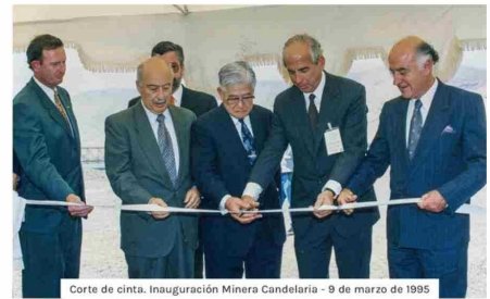
Corte de cinta. Inauguración Minera Candelaria - 9 de marzo de 1995

Del mismo modo, uno de los elementos que destacan en la gestión de la compañía es su contribución al desarrollo de las comunidades cercanas a sus operaciones. Esto, en el marco de la Política de Minería Responsable que rige su quehacer. En ese contexto, ha contribuido al desarrollo y bienestar de la Región de Atacama con la implementación de un Programa de Inversión Social con énfasis en proyectos en los ámbitos de salud,