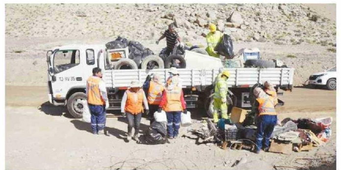
TRES TONELADAS DE BASURA FUERON SACADAS DEL LUGAR.