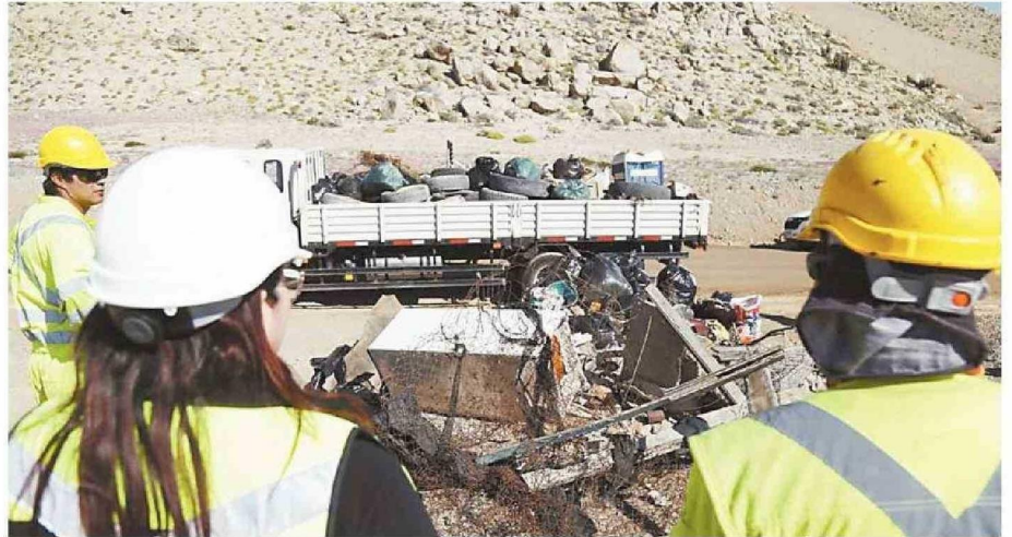
INSTANCIA NACE DE UN TRABAJO COLABORATIVO CON CONAF Y VIALIDAD, Y DE LOS EQUIPOS MUNICIPALES DE LA DIRECCIÓN DE OPERACIONES.