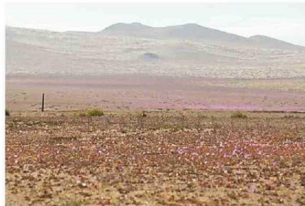
JORNADA TUVO LUGAR EN EL PARQUE NACIONAL DESIERTO FLORIDO.