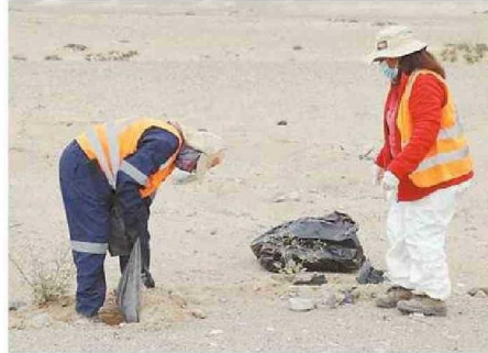
GESTIÓN CONJUNTA PERMITIÓ OPERATIVO DE LIMPIEZA.