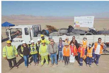
AUTORIDADES HICIERON UN LLAMADO PARA CUIDAR EL SECTOR.