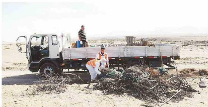
RECOMIENDAN NO INGRESAR A PIE EN LA ZONA PARA CUIDAR FLORACIÓN DE INVIERNO.