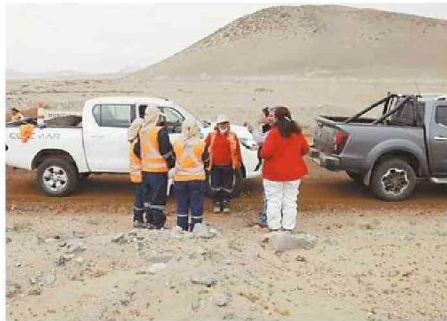
EQUIPOS RETIRARON DEL LUGAR DIVERSOS TIPOS DE DESECHOS.