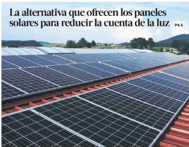
La alternativa que ofrecen los paneles solares para reducir la cuenta de la luz P4-5