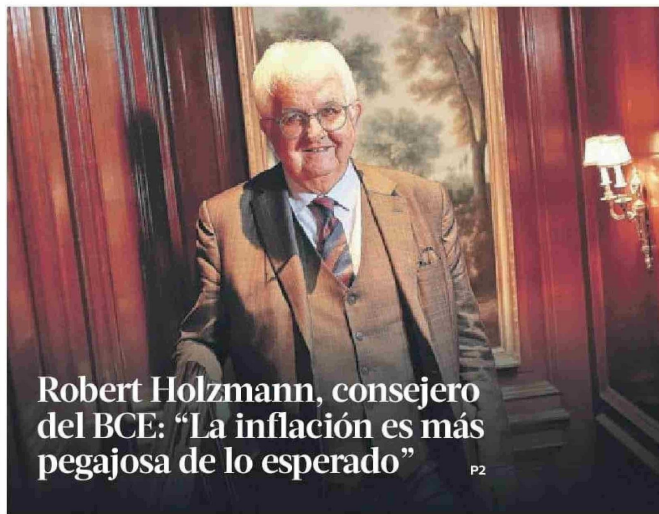
Robert Holzmann, consejero del BCE: "La inflación es más pegajosa de lo esperado" P2