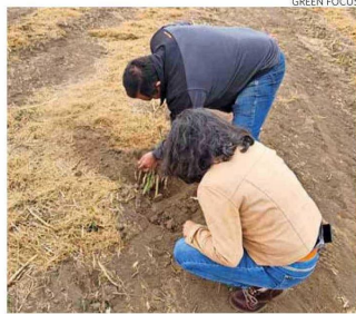
Algaflex ha demostrado ser eficaz inhibiendo patógenos alimentarios.