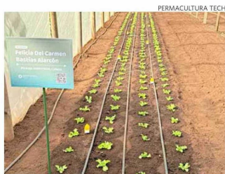
Estas lechugas las riegan a partir de las indicaciones de la IA.

"Lo vivido con mis papás me motivó a estudiar Ingeniería Civil en Automatización y combiné mis estudios universitarios con mi mundo, el mundo rural. Así nace Permacultura Tech.