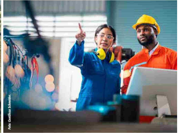
De Izq. a Der.: Planta en Santiago de Schneider. Schneider comprometida en la gestión de activos en la minería.

planteado, el académico de la Universidad de Santiago manifiesta que “al incrementar la disponibilidad de los activos se contribuye a alcanzar mayores niveles de utilización, lo que, a su vez, incrementa la productividad al reducir las interrupciones en los flujos de