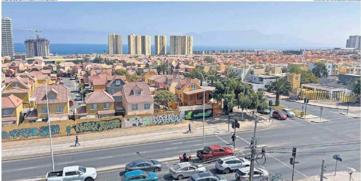
EL EMPLAZAMIENTO DE CONDOMINIOS CON CASAS DE ALTA PLUSVALÍA ES UNA DE LAS CARACTERÍSTICAS QUE DEFINE A ESTA ZONA URBANA DE ANTOFAGASTA.

“Aunque independiente de todos los avances que pudiera haber, cuando tenemos que hacer un trámite tenemos que ir al centro, porque los servicios públicos están allá.