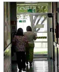
Actualmente, hay 2,5 millones de prestaciones atrasadas.

Otra propuesta, indica Sánchez, es "flexibilizar en forma inteligente la gestión médica para incentivar el trabajo fuera de horarios normales, sujeto a normas e incentivos claros y bien gestionados y supervisados para evitar el abuso", y "resgatar más recursos a establecimientos que claramente lo requieren, pero amarrados a cumplimiento de indicadores y metas, sancionando el incumplimiento".