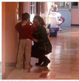
En abril de 2022, el Mineduc lanzó el plan de reactivación educativa, pero los resultados mantienen preocupados a los expertos.

Aunque el Ejecutivo ha destacado mejoras en los indicadores de aprendizajes, asistencia y reactivación escolar, el rezago que dejó la extensa interrupción por la pandemia mantiene la preocupación sobre el desarrollo de los escolares, a la espera de que se evidencien avances sustanciales en la denominada "reactivación".