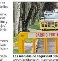
Las medidas de seguridad deben involucrar un esfuerzo mancomunado entre diversas instituciones, plantean especialistas.

Añade que "luego la estrategia debe considerar incentivos económicos para las familias y municipios para la reinserción escolar de jóvenes desahucados, instalación de 'oficinas de oportunidades laborales' de cooperación público-privada para dar trabajos lícitos a jóvenes y adultos".