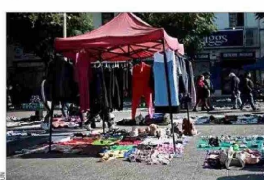
DERRUIDOS.— Sectores de la capital como Meiggs o la Vega Central se han deteriorado de la mano de la actividad informal.

Con distintos tipos de medidas, que van desde equipos de fiscalización hasta el aumento de permisos municipales, algunas autoridades han buscado enfrentar el fenómeno del comercio ambulante, que prolifera en barrios comerciales de las distintas ciudades.