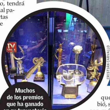
Muchos de los premios que ha ganado en su trayectoria son parte de la exhibición.

que escribió, se saltan ese módulo”, explica el curador de la exposición, José Antonio Soto. Por ello, la muestra se presenta como si fueran distintos canales y el espectador puede elegir cuáles visitar.