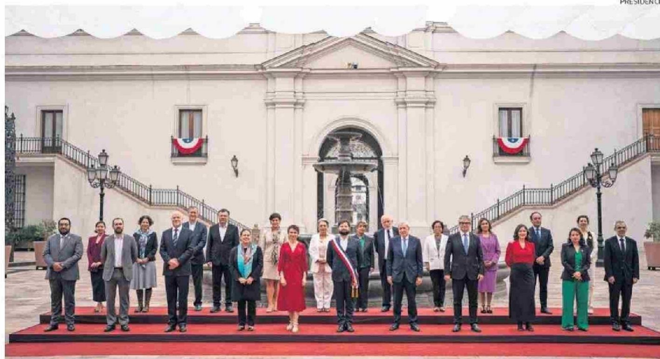
PRESIDENTE EN LA FOTO OFICIAL POR EL "18", CON 22 DE 24 MINISTROS: DE LA MUJER Y ENERGÍA SE AUSENTARON.