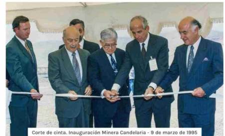
Corte de cinta. Inauguración Minera Candelaria - 9 de marzo de 1995

Del mismo modo, uno de los elementos que destacan en la gestión de la compañía es su contribución al desarrollo de las comunidades cercanas a sus operaciones. Esto, en el marco de la Política de Minería Responsable que rige su quehacer. En ese contexto, ha contribuido al desarrollo y bienestar de la Región de Atacama con la implementación de un Programa de Inversión Social con énfasis en proyectos en los ámbitos de salud,