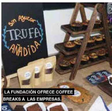
LA FUNDACIÓN OFRECE COFFEE BREAKS A LAS EMPRESAS.