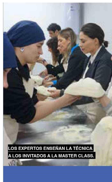
LOS EXPERTOS ENSEÑAN LA TÉCNICA A LOS INVITADOS A LA MASTER CLASS.