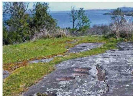
LAS PIEDRAS TACITA ENCONTRADAS EN EL SITIO JUNTO A LA PIEDRA ANTÜKURA.