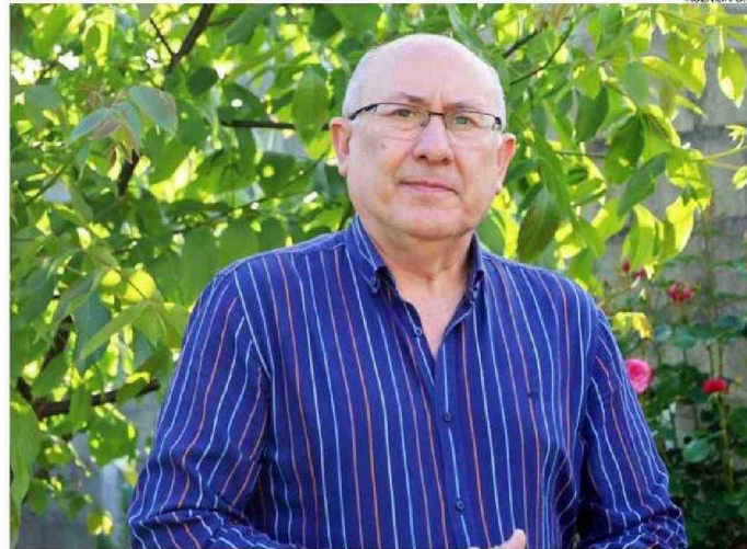
CANDIA NO DESCARTA UNA CANDIDATURA PARLAMENTARIA DURANTE 2025.

las elecciones parlamentarias en todo el país, donde el distrito 25 tiene 4 cupos en para su representación en la Cámara de Diputados.