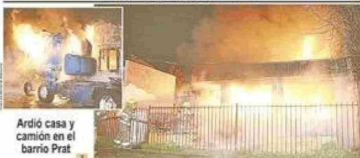
Ardió casa y camión en el barrio Prat