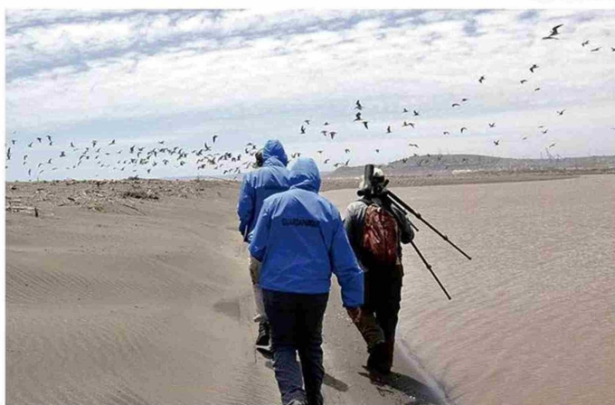
SEIS MESES DE EXTENSIÓN TENDRÁ EL CURSO.