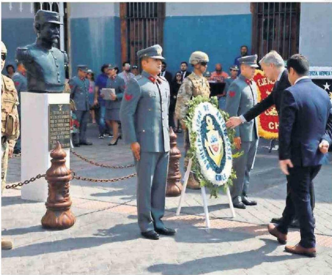
AUTORIDADES DEJARON LA OFRENDA FLORAL EN EL BUSTO DEL CORONEL EMILIO SOTOMAYOR.

Desde primera hora iniciaron las actividades protocolares en Antofagasta. Desde la visita al mausoleo de los Veteranos de 1879 hasta conocer a la primera bebé que nació este 14 de febrero en la comuna.