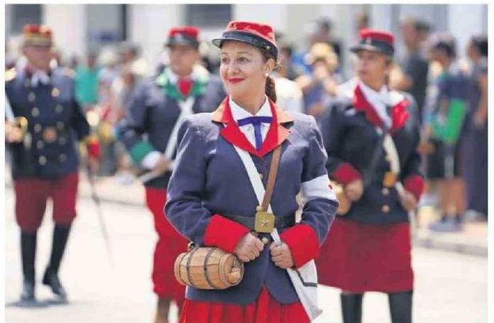
TAMBIÉN SE HONRÓ EL PAPEL QUE TUVIERON LAS MUJERES EN LA GUERRA DEL PACÍFICO.

“ Se ha rescatado y se ha puesto en valor a las figuras de nuestra región, a través del Ancla de Oro y también todas las actividades que se han hecho que tienen este componente tradicional”