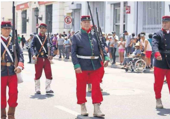
LA AGRUPACIÓN LOS VIEJOS ESTANDARTES TAMBIÉN DESFILÓ.

en valor a las figuras de nuestra región, a través del Ancla de Oro y también todas las actividades que se han hecho que tienen este componente tradicional”.