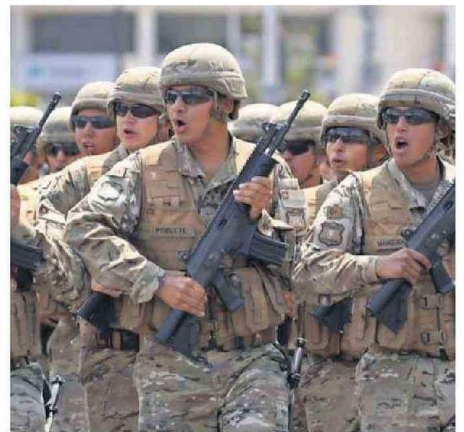
EL DESFILE SE REALIZÓ AL MEDIODÍA EN ANTOFAGASTA.

realizará el tradicional ascenso al Cerro El Ancla a las 8:00 horas, donde los deportistas competirán por obtener el primer lugar de la carrera.