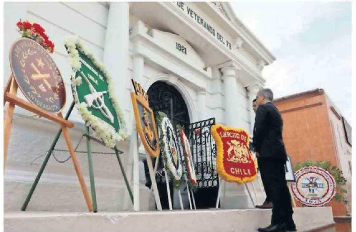
SE RINDIÓ HOMENAJE EN EL MAUSOLEO DE LOS VETERANOS DE 1879 EN EL CEMENTERIO GENERAL.

Además, el próximo domingo 23 de febrero se