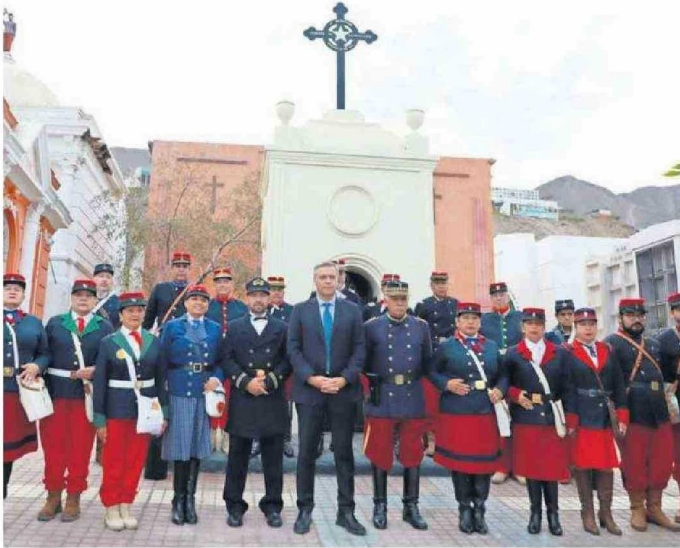
EL ALCALDE SACHA RAZMIJIC Y LA AGRUPACIÓN HISTÓRICA LOS VIEJOS ESTANDARTES.

Tiraje: 2.600 Lectoría: 7.800 Favorabilidad: No Definida