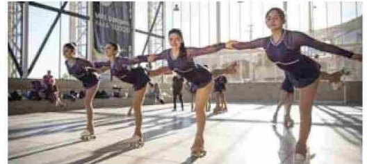
La infraestructura deportiva ha sido uno de los ejes del programa, destacando los estadios y centros comunitarios como El Polígono de Illapel.