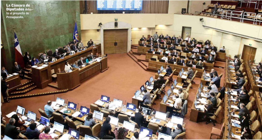
La Cámara de Diputados debate el proyecto de Presupuesto.