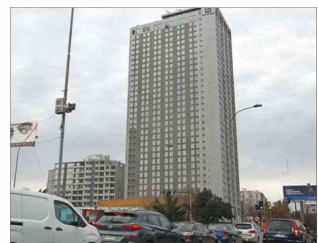
Torre construida en una intersección de alto tránsito en Estación Central.