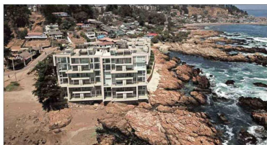
El proyecto inmobiliario Rocas de Maitencillo es un símbolo de los problemas que hubo en la tramitación de una dirección de obras municipales.

Con varios desafíos por delante, el exministro de Defensa y exparlamentario Mario Desbordes (RN) arribará a la alcaldía de Santiago, tras derrotar a Iraci Hassler (PC).