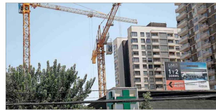
Construcciones de edificios en sectores alrededor de avenida Macul, donde hay varias obras inmobiliarias frenadas.

En Macul existen proyectos por US$ 500 millones que están detenidos por diversas demoras de la Dirección de Obras Municipales (DOM). A este municipio arribará el republicano Eduardo Espinoza, quien derrotó al actual alcalde, Gonzalo Montoya —hasta 2022 del partido Comunes—, lo que ven con alivio desde las inmobiliarias afectadas, señalaron a "El Mercurio".