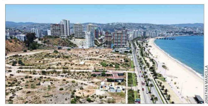
Inmobiliaria Las Salinas busca sanear y reconvertir los terrenos que antiguamente se usaron para almacenar combustibles y petroquímicos.

Labarca agregó que "un proyecto como Las Salinas, por su escala y las exigencias que significa impulsar una iniciativa de regeneración ambiental, excede los tiempos de cualquier alcaldía en particular". Destacó que "la sinergia positiva entre los sectores público y privado ha demostrado siempre ser la base de grandes oportunidades".