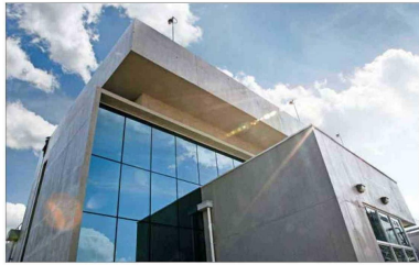
Google tiene un data center ubicado en Quilicura. En Cerrillos planeaba construir una estructura en un terreno más amplio.