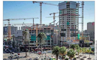
Las labores de construcción del conjunto inmobiliario Egaña Comunidad Sustentable fueron retomadas.

Sichel ha señalado que se enfocará en realizar una "buena gestión" y en la seguridad. Asimismo, pondrá foco en el desarrollo de las pymes y en potenciar ejes comerciales de la comuna como la avenida Irarrázaval. Respecto del proyecto en Plaza Egaña, ha comentado que está resuelto por decisión judicial.