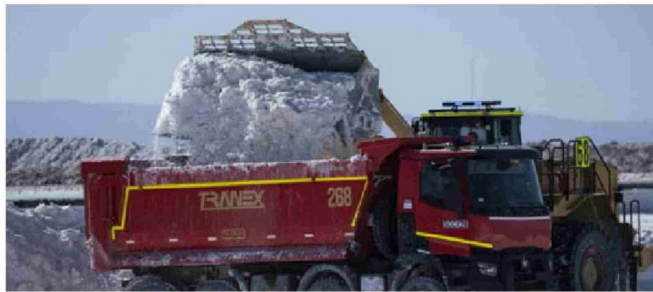
PRECIO DEL LITIO DE SQM SE DESPLOMA 84% DESDE SU PEAK

La merma en los ingresos provenientes del litio se vio parcialmente compensada con un alza en los volúmenes de ventas. En el tercer trimestre, se vendieron 51,2 mil toneladas métricas,