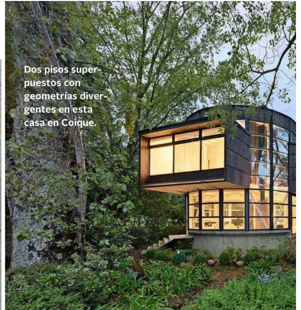
Dos pisos superpuestos con geometrías divergentes en esta casa en Coique.