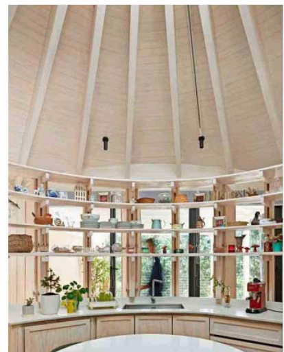
Casa en Nonguén. Estructura de madera laminada Lamitec y revestimientos y puertas de pino finger.